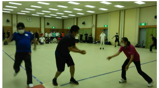
写真・記事 長崎より子 情報委員会(千代田区)

学生のためのオリンピックと呼ばれるユニバーシアード2026の正式種目にもなるそうです。