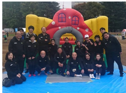
渋谷くみんの広場 「ふるさと渋谷フェスティバル2018」