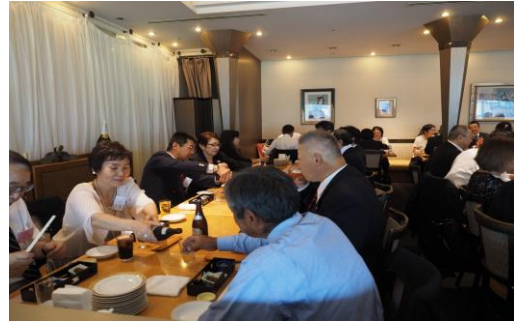
祝賀会で和気あいあいと