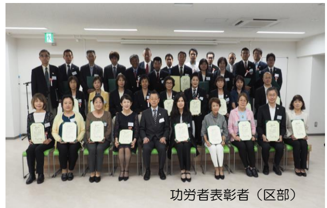
功労者表彰者（区部）