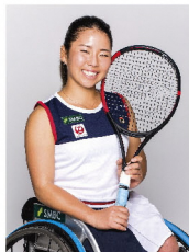
上地 結衣 選手 車いすテニス パリ2024パラリンピック金メダリスト