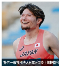
山田 真樹 選手 デフ陸上 サムスン2017デフリンピック金メダリスト